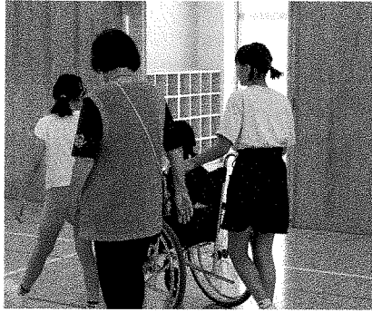
▲福祉体験学習(車椅子体験)

社会福祉協議会では、年4 回町民の皆様、区長会等のこ 協力により各種会費募集・募 金を実施しています。 なお、令和6年度の日赤活動 資金募集、社協会員会費の実 績額は次のとおりです。 ご協力大変ありがとうございました。